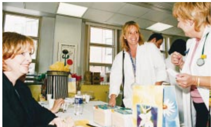
Hôpital Montréal pour enfants