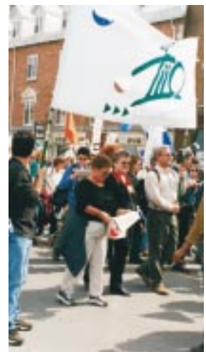
En page couverture Marche des peuples des Amériques

Une démarche exploratoire d'affiliation : pourquoi? 15