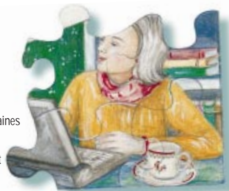
Line Lanseigne conseillère, secteur Sécurité sociale

effet rétroactif au 1 er janvier 2000. Certaines infirmières, encore actives âgées de 55 ans et plus, recevront des informations de la CARRA prochainement. Les autres, incluant les infirmières retraitées, recevront l'information provenant de la CARRA à l'automne 2001.