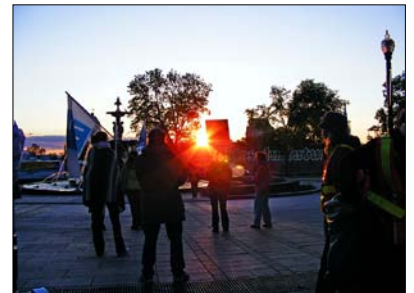
Le jour se lève