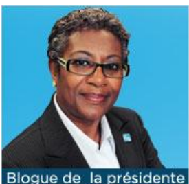
Blogue de la présidente

Nos aînés ne sont pas de vulgaires pièces mécaniques!